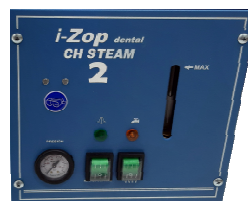
Panel de mandos sencillo y orientativo con nivel de agua